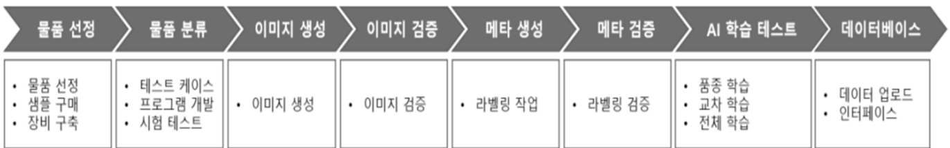
그림5 학습용 데이터 구축 과정