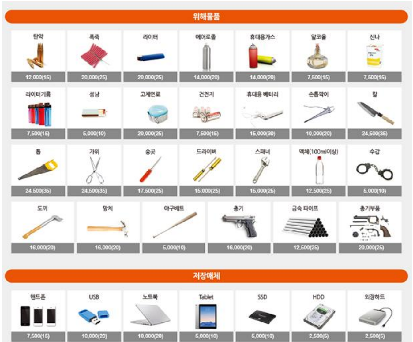
그림 2 데이터셋 구성