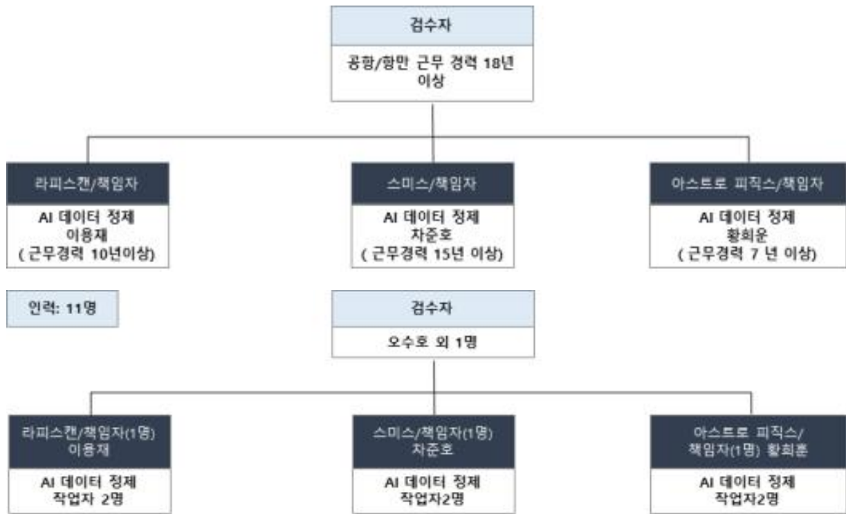
그림 7 품질 확보를 위한 2단계 품질 검수 체계